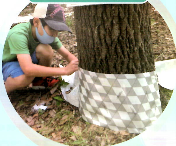
鶴二おやじたちの会 (東京都)