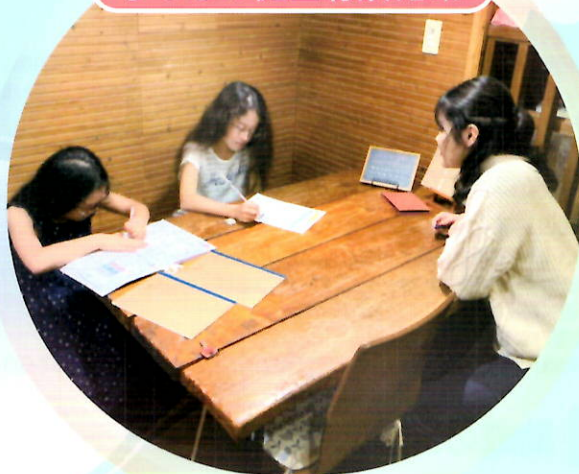
特定非営利活動法人Cafe de 寺子屋 (静岡県)